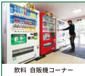
飲料 自販機コーナー