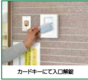
カードキーにて入口解錠