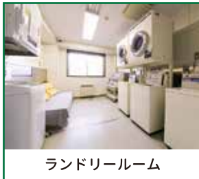
ランドリールーム